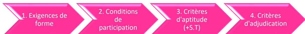
Schéma de la procédure ouverte ?

D'autres éléments font encore partie d'une publication ad hoc, ils sont discutés lors de l'élaboration du projet ainsi que la détermination des équipes qui feront partie du projet.